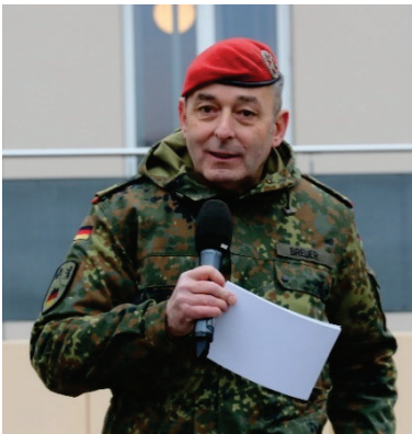
Bild 10 Generalmajor Carsten Breuer eröffnet als Hausherr den Tag der offenen Tür